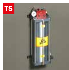
Dispositivo taglio a secco Dry cooling device