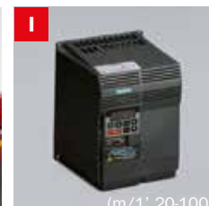
Inverter Frequency converter