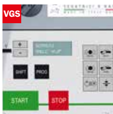
Visualizzatore gradi angolo di taglio Cutting angle display