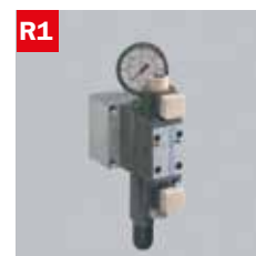
Reg. pressione morse Adjustable vice pressure