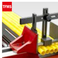
Taglio fascio meccanico Mechanical bundle clamping device