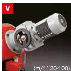
Motovariatore Blade speed variator