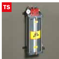
Dispositivo taglio a secco Dry cooling device