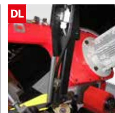
Dispositivo controllo deviazione lama Blade deflection control device