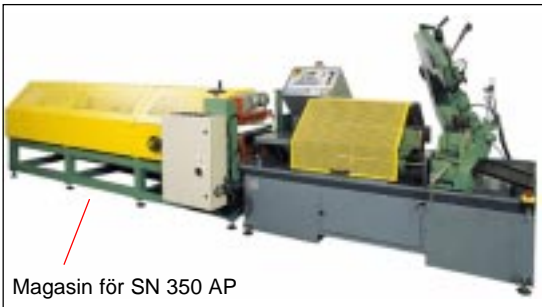
Magasin för SN 350 AP

Styrningen på SN 350 AP-CN är en PLC & NC speciellt framtagen för automatiska bandsågar. Den styr maskinen genom att integrera PLC funktionerna för maskinsekvenserna med NC funktionerna för kontroll av axlarna på matningsvagnen och bågens sänkning.